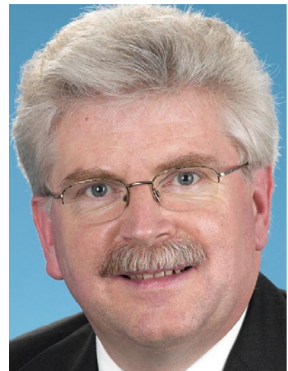
Martin Zeil, MdB

Was die Öffnung an Sonn- und Feiertagen betrifft, so soll die Entscheidung darüber den Gemeinden und kreisfreien Städten übertragen werden. „Diese“, so der langjährige Kommunalpolitiker aus Gaubing weiter, „wissen am besten, ob und welche Öffnungszeiten an solchen Tagen erforderlich sind. Auch regionale Besonderheiten können so besser berücksichtigt werden, als mit einer starren Regelung aus